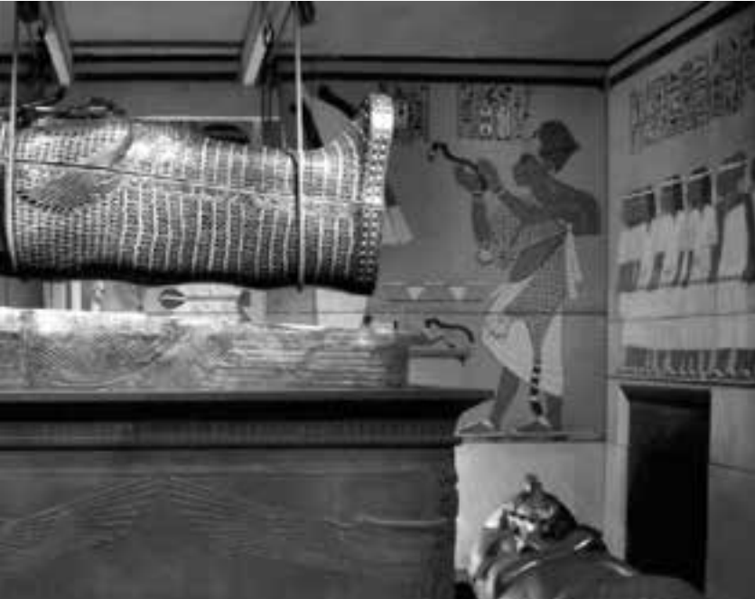
El sarcófago de Tutankamón