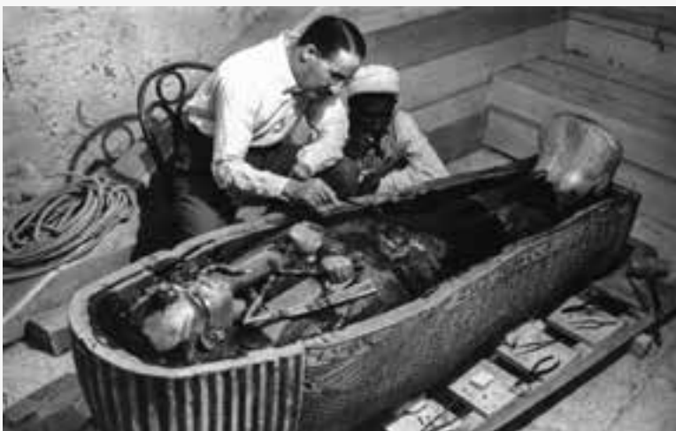
Carter con su descubrimiento.

de Tutankamón, de una belleza sin igual: imágenes de batallas, imágenes de la vida íntima del faraón, la corte que lo acompañaba y mucho más. Negro, rojo, azul, verde, blanco combinados con una simpleza y organización que nos obliga a admirar la genialidad de este pueblo, con las limitaciones de la época en que se desarrollaba.