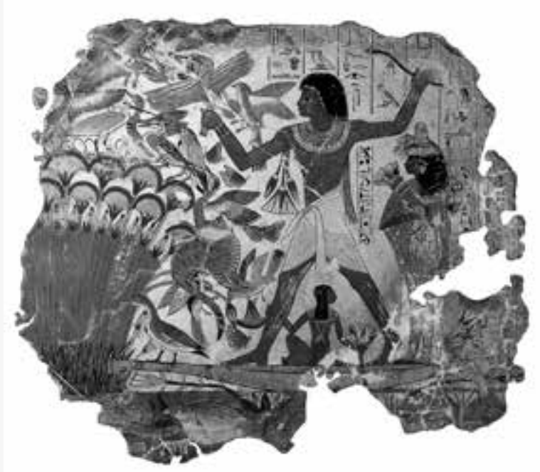
Tumba de Nebamun. Caza entre papiros